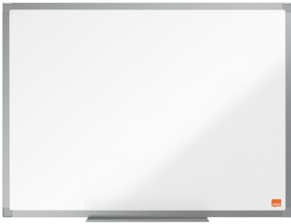
Tableau Blanc emaille 450x300 mm Nobo